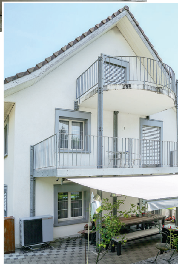
WSB 10-A-RME-AI: ein kompaktes, unauffälliges Aussengerät, das es in sich hat: hocheffizient und trotzdem leise.

Da das Ausdehnungsgefäß integriert ist, war keine zusätzliche Installation eines Expansionsbehälters nötig. Das einzige Element, das durch den Gasheizungsersatz dazu gekommen ist, ist der Pufferspeicher PU 100, der dank seiner kompakten Abmessung problemlos Platz im Technikraum fand. Dieser gewährleistet nicht nur einen effizienten Betrieb der Wärmepumpe durch längere Laufzeiten, sondern auch konstante Heizwassertemperaturen, was den Wohnkomfort steigert.