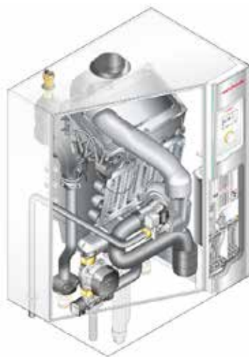
Schnittgrafik des neuen Gas-Brennwertgerätes Weishaupt Thermo Condens WTC-GW 45/60-B.